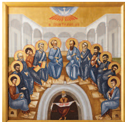
Αδαμάντιος Διαμαντής, Η Πεντηκοστή, Κρατική Πνακοθήκη.

νών Σταυροβουνίου, του τουρκοκρατούμενου Αποστόλου Βαρνάβα, του Αγ. Γεωργίου Αλαμάνου, της Τροοδίτισσας και του Μαχαίρα, καθώς και έργα κοσμικών ζωγράφων όπως των Παύλου Παυλίδη, Βασίλη Μιχαηλίδη, Αδαμάντιου Διαμαντή, Όθωνος Γιαβόπουλου, Ιωάννη, Ανδρέα Χρυσόσκου, Πανάρητου Κουσουλίδη, Νικόλαου Κουνελάκη, Μιχαήλ Χριστοδουλίδη, Ιωάννη Κισσονέργη, Σολωμού Φραγκουλίδη, Νίκου Νικολαΐδη, Γαβριήλ Θεοχαρίδη. Από καλλιτεχνικής πλευράς στην Έκθεση ξεχωρίζει η θύρα-παραπέτασμα του Ιερού Βήματος με τον Χριστό ως Μέγα Αρχιερέα, πίνακα σε δέρμα του Πανάρητου Κουσουλίδη και από την κο-